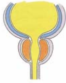
Abb.: Die normale Prostata