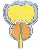
Abb.: Die vergrößerte Prostata engt die Harnröhre ein

Bei der Beurteilung des PSA-Wertes ist wichtig zu wissen, dass ein überhöhter Wert auch auf eine gutartige Vergrößerung der Prostata zurückgehen kann.